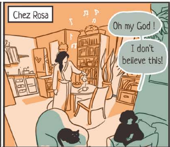
Billie regarde des vidéos sur son téléphone.